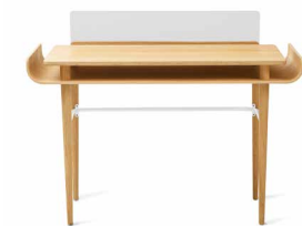
white grey popielaty biały