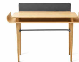
graphite grey grafitowy szary

TABLICA DAJE MOŻLIWOŚĆ UŻYCIA MAGNESÓW (NIE WYSTĘPUJĄ W ZESTAWIE), A JEJ MONTAŻ JEST OPCJONALNY.