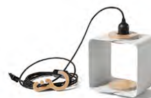
white grey popielaty biały RAL9018

DZIĘKI RUCHOMEMU HACZYKOWI ISTNIEJE MOŻLIWOŚĆ REGULACJI WYSOKOŚCI ZAWIESZENIA LAMPY; STANDARDOWA ŻARÓWKA E27, MAX 60W; PRODUKT NIE ZAWIERA ŻARÓWKI