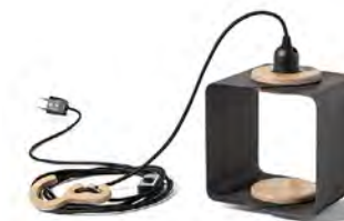
graphite grey graftowy szary RAL7015