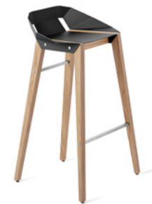
deep black głęboki czarny