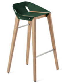
dark green butelkowy zielony