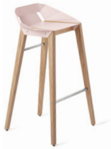
pale pink pudrowy róż