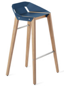
navy blue ciemny niebieski