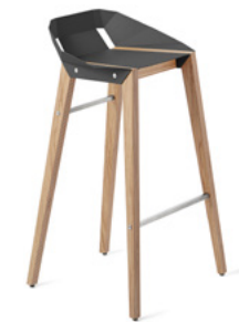
graphite grey grafitowy szary