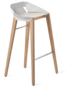
white grey popielaty biały