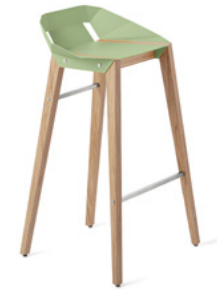
mint green miętowy zielony