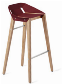
royal burgundy royal bordo