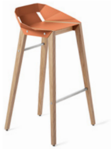
dusty clay retro oranż