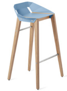
pastel blue pastelowy niebieski