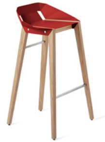
coral red koralowy czerwony