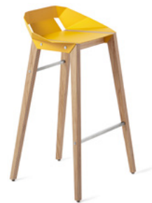
sunny yellow słoneczny żółty